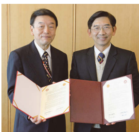
西澤学長(左)とタマサート大学のロアトバイタウン総長(右)

平成26年2月21日(金)にタイのタマサート大学から総長をはじめ関係者が来学し、協定調印式を執り行いました。今回は大学間協定の他に医学研究科、看護学研究科がそれぞれタマサート大学と部局間協定を締結するという調印式となり、その後の意見交換会でも積極的な交流についての提案が行われました。