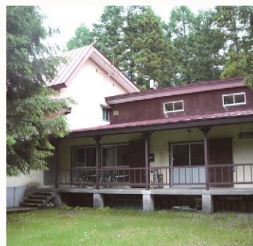
40周年を迎えた大阪市立大学白馬セミナーハウス

平成26年3月15日(土)に長野県北安曇郡白馬村の大阪市立大学白馬セミナーハウスにおいて、創立40周年記念式典が開催されました。