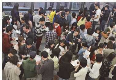
写真(左) 交流会を企画した学生ボランティアスタッフ「OGM」のメンバー 写真(右)「人探し」ゲームで親睦を深める学生たち